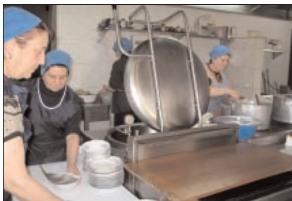
Quotidiennement, 240 personnes viennent prendre leur repas du midi cachère au centre communautaire.

situation a commencé à s'améliorer. Il n'en reste pas moins que les services sociaux et de la santé sont encore et toujours nettement sous-financés. L'histoire des Juifs de Géorgie remonte très loin puisque certaines personnes parlent d'une présence juive dans ce pays il y a 2600 ans déjà. Contrairement à la majorité des républiques soviétiques, les Juifs géorgiens ont échappé à l'anti-sémitisme virulent et à l'athéisme forcé. Par conséquent, pendant la domination soviétique, ils ont pu maintenir leur identité juive et leurs traditions ancestrales. Dès la libération, des dizaines de milliers de Juifs géorgiens sont partis vivre en Israël. Ceux qui restent aujourd'hui habitent à 90% dans la capitale, Tbilissi, et les autres à Gori, Kutasi, Batumi et Oni.