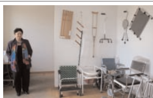
En Géorgie, il n'existe pas d'assurance maladie. Le JDC apporte une aide médicale à plus de 400 personnes par mois.

Bien entendu, l'action principale de notre centre réside dans l'aide sociale que je dirige. Nous ap-