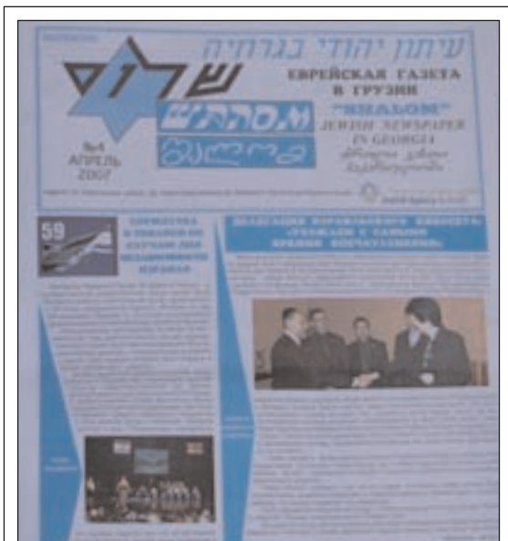
Le centre publie régulièrement un certain nombre de journaux juifs à caractère communautaire.

portons une aide directe à 1500 personnes âgées et à 200 enfants. Le programme le plus important est celui de la distribution de nourriture. Quotidiennement, 240 personnes viennent prendre leur repas du midi cachère au centre communautaire. De plus, nous livrons 80 repas par jour à domicile. Une fois par mois, nous distribuons environ 1400 paquets de nourriture non périssable, et ce depuis 10 ans déjà. Quant à l'aide aux enfants, elle commence le jour de leur naissance et se termine pratiquement à la fin de leur adolescence. Dans la plupart des cas, nous leurs procurons tout ce dont ils ont besoin sur le plan médical ainsi que des vêtements, de la nourriture et des jouets. Nous nous occupons de leur éducation (nous les inscrivons dans l'une des deux écoles juives de la ville), organisons pour eux des activités juives et culturelles et même des camps de vacances.