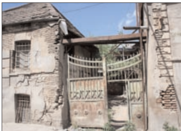
Le nouveau centre communautaire de Tbilissi se trouve dans un quartier en pleine rénovation.

groupe de danses folkloriques israéliennes, etc. Ce programme concerne quelques dizaines de personnes.