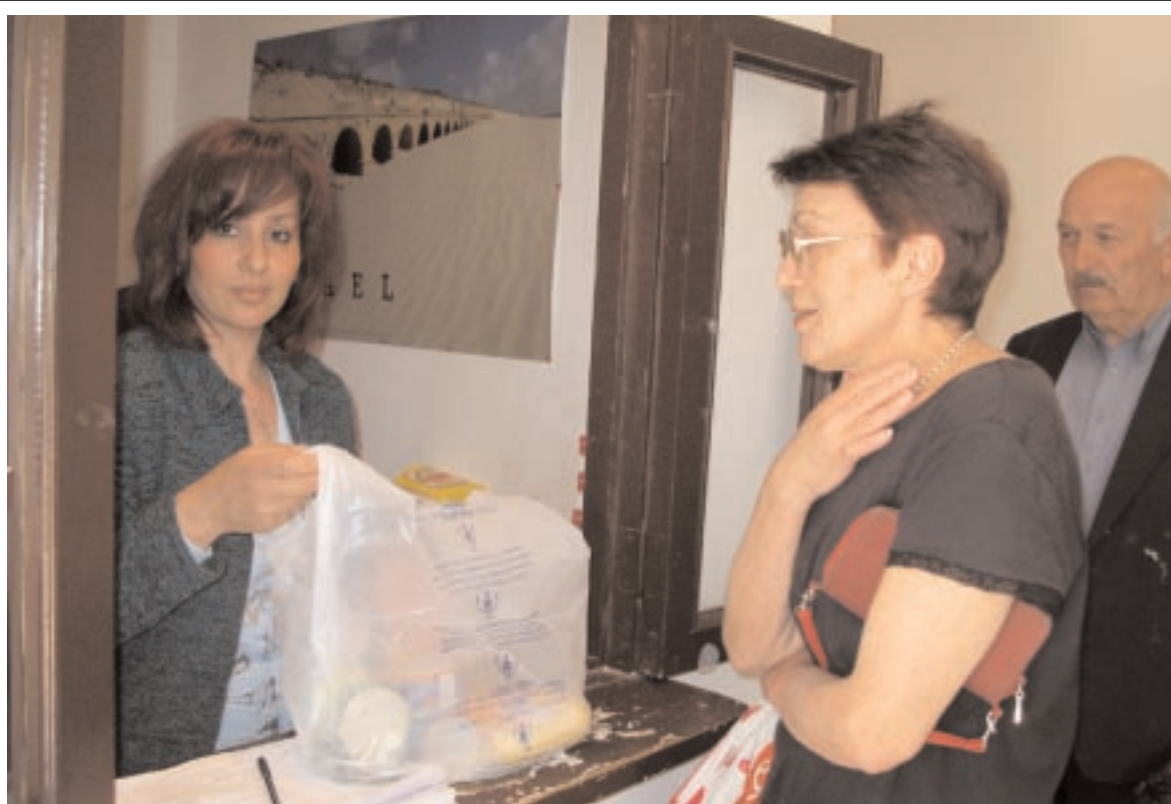
A Tbilissi, le JDC distribue 80 repas par jour à domicile. Une fois par mois, il offre environ 1400 paquets de nourriture non périssable, et ce depuis 10 ans déjà.